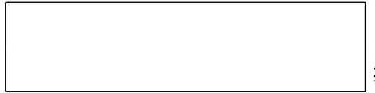
Схема границы балансовой принадлежности

д) границей эксплуатационной ответственности объектов централизованной системы водоотведения исполнителя и заявителя является: