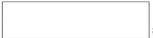
Схема границы балансовой принадлежности

е) границей эксплуатационной ответственности объектов централизованной системы холодного водоснабжения исполнителя и заявителя является: